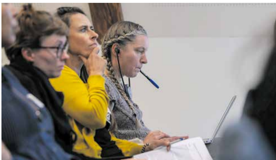
Reduktimin e të drejtave themelore të migrantëve mund ta ndalim vetëm së bashku.

Reduktimin e të drejtave themelore të migrantëve mund ta ndalim vetëm së bashku. Kjo konferencë është një fillim i mirë i mobilizimit për pjesëmarrje më të mirë për të gjithë njerëzit në Zvicër. Pas këtij fillimi të suksesshëm, është e rëndësishme të rritemi dhe të zbatojmë një politikë migrimi në Zvicër të bazuar në solidaritet.