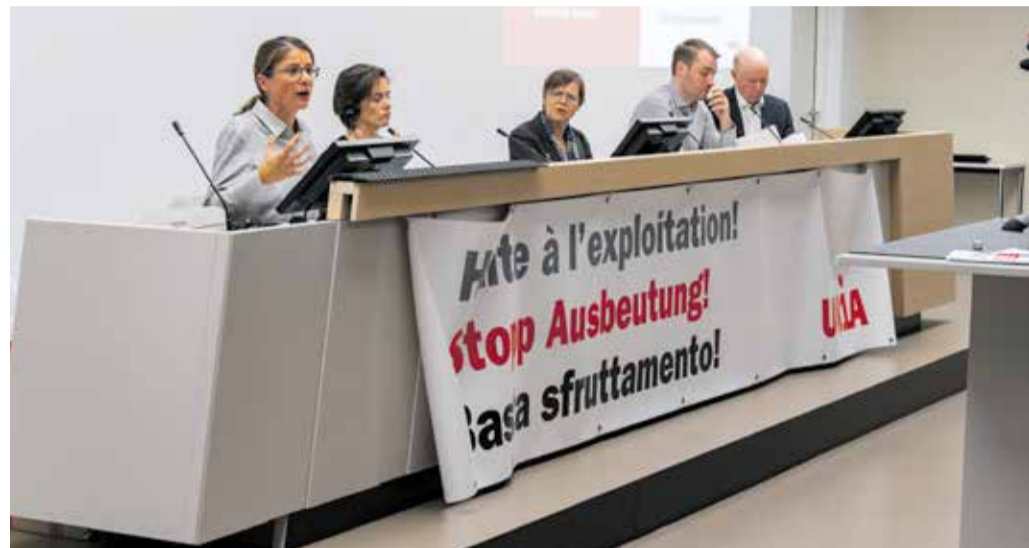
Unia angazhohet për ndalimin e trafikimit të njerëzve dhe shfrytëzimin çnjerëzor të tyre

Ajo që mund të duket e çuditshme në shikim të parë është fatkeqësisht e vërtetë: trafikimi i qenieve njerëzore ndodh edhe në Zvicër dhe rastet e raportuara vazhdojnë të rriten. Unia e ka trajtuar këtë çështje dhe është përfshirë si partner social në Planin e 3-të Kombëtar të Veprimit kundër Trafikimit të Njerëzve (2023-2027). Më 23 tetor 2023, në selinë qendrore të Unia-s, në Bernë, u zhvillua simpoziumi kundër trafikimit të qenieve njerëzore me qëllim shfrytëzimi si fuqi pune.