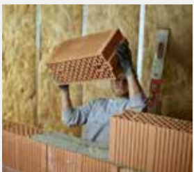
SHPINA E THYER, Job Futsch: Pas një lëndimi të shtyllës kurrizore për një murator parashi-het ndërimi i profesionit.

Unë punoi qe 15 vite si murator për një ndërmarrje ndërtuese. Puna është e rëndë fizikisht. Unë ka vite që kam dhimbje kurrizi. Para disa muajsh pësova lëndim të shtyllës kurrizore dhe që nga ajo kohë jam i paafat për punë. Unë përfitoj nga sigurimi i parave të mëditjeve në rast sëmundjeje. Sigurimi në fjalë tani më shkruar se do të ndalë pagesën e mëditjeve shkaku i dëftesës mjekësore të mjekut të besuar të sigurimit, pasi unë do të mund të isha i aftë 100% për një punë tjetër, e cila nuk do të ishte rëndë për mua dhe ku unë pjesërisht do të mund të punoja ulur. Mjeku im personal gjithashtu ka mendim të ngjashëm. Megjithatë: A lejohet që sigurimi i mëditjeve në rast sëmundjeje papritur të mi anulohet përfitimet?