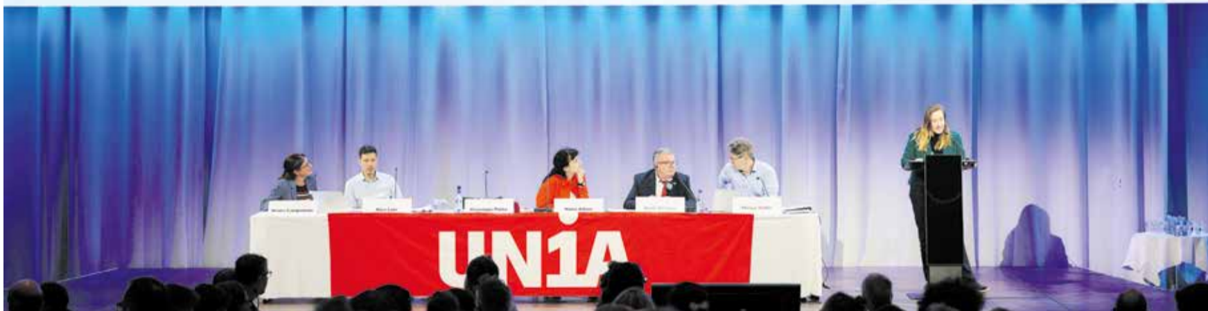
Pamje nga punimet e kongresit të jashtëzakonshëm të Unia: Prioritet pensione e paga më të mira dhe ulje të kohës të punës

Kongresi i jashtëzakonshëm i Unia u zhvillua me 21 tetor 2023 në Bernë. Rreth 300 delegatë vendosën mbi reformës statutare dhe mbi rezolutat e fushatave të rëndësishme të Unia: pensione më të mira, paga më të mira dhe një reduktim të orarit të punës me pagë të plote e kompensim personeli.